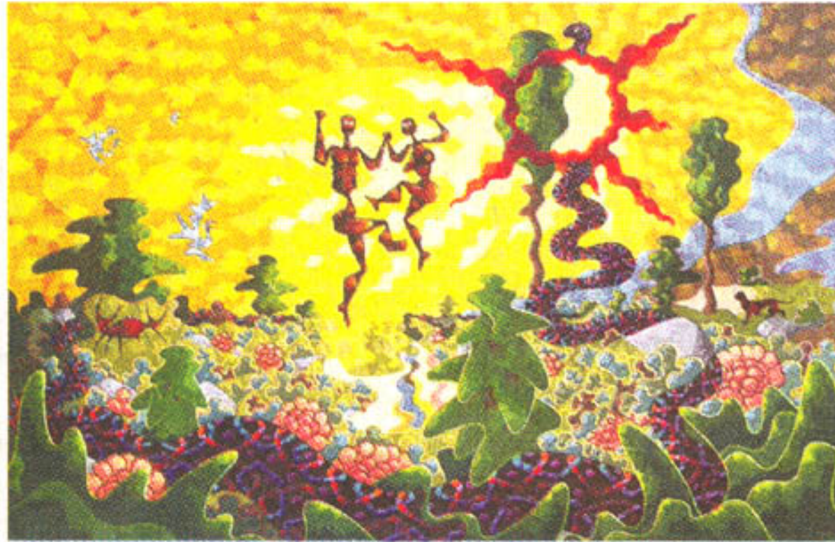
bild werden die verschobenen Perspektiven sowie die zu lang geratenen Gliedmaßen wieder in Beziehung zueinander gesetzt und sind in sich stimmig.

Seine Figuren dienen als Allegorie für die Gegenwart, was uns seine Götter so vertraut und menschlich macht. Überzeichnete, teils sogar grotesk anmutende oder sich unnatürlich verrenkende Figuren gehen ursprünglich auf sein künstlerisches Auge zurück, das er auf seinen Reisen durch Europa, vor allem an der klassischen Schönheit der Antike, schulen konnte. Im Gesamt-